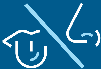
Tab af smags- og lugtesans