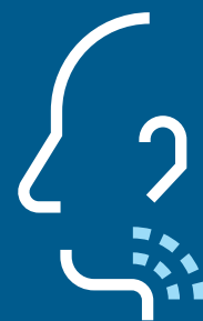
Ondt i halsen

Bliv også hjemme, hvis du er i tvivl, om du er syg. Gå i selvisolation og sørg for at blive testet.